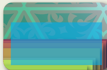
Überlappung der Grafiken und des mit Hochprägung bedruckbaren Bereichs